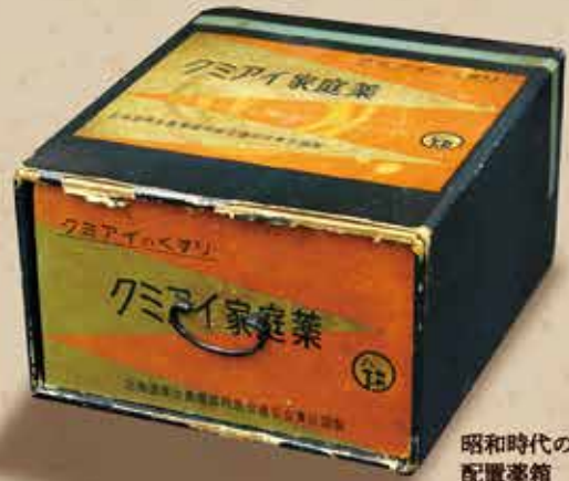
昭和時代の 配置薬箱