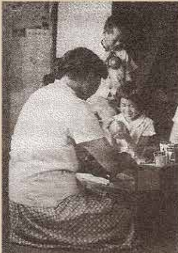
家庭薬を配置している風景

日本の家庭薬と共に歩んできた「JA配置薬」は、これからも健康で豊かな暮らしを応援していきます。