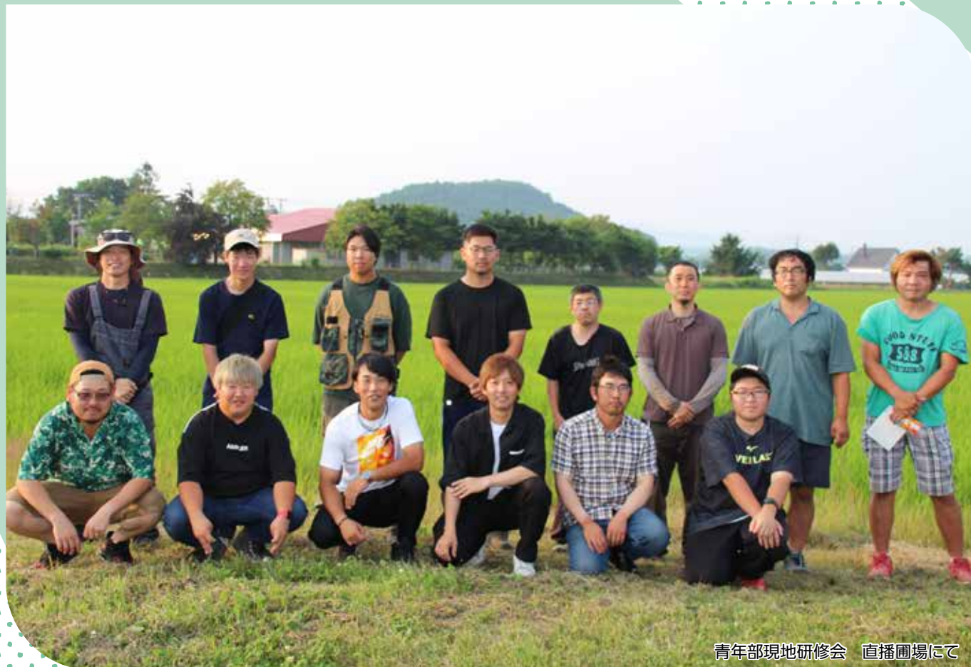
青年部現地研修会 直播圃場にて