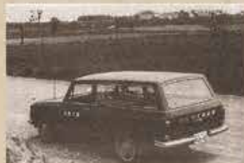
普及推進のため農村を行くクミアイ家庭薬車