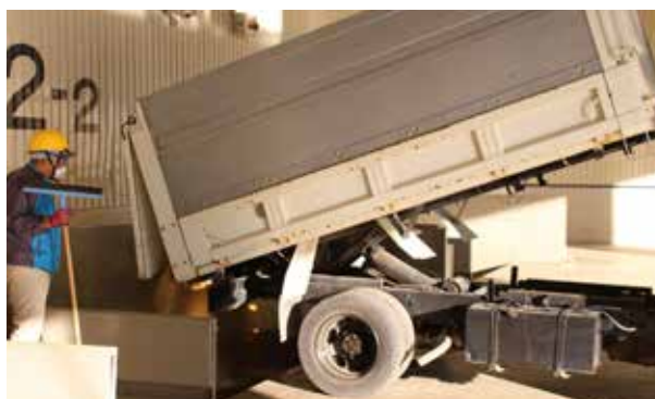
カントリー初日の風景

当麻町カントリーエレベーターへの令和6年産米の初搬入が行われ、ほしのゆめ、ゆめぴりか、きたくりんを33件の生産者が搬入を行いました。荷受初日は朝から晴天に恵まれ、絶好の刈り取り日和となり、約53ヘクタール、約482トンの荷受けが行われ、今年度の出来秋がスタートしました。