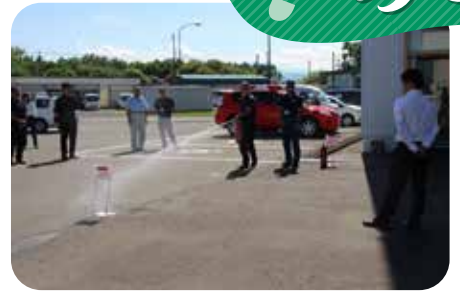
本部事務所での訓練の様子

JA当麻では、利用者の皆様に緊急時でも安全に対応できるよう定期的な訓練と日頃から防災意識を高め、これからも安心してご利用いただけるJAを目指してまいります。