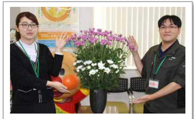
金融共済課共済係