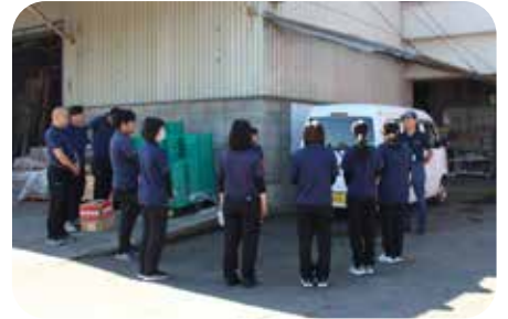
資材事務所での訓練の様子