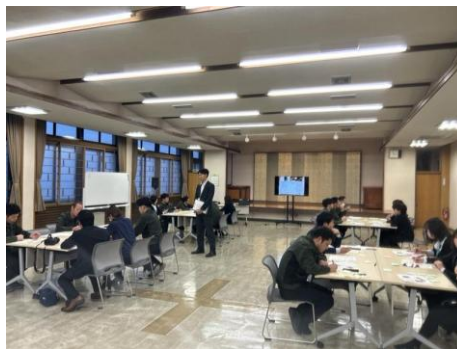
コンプライアンス研修会の模様