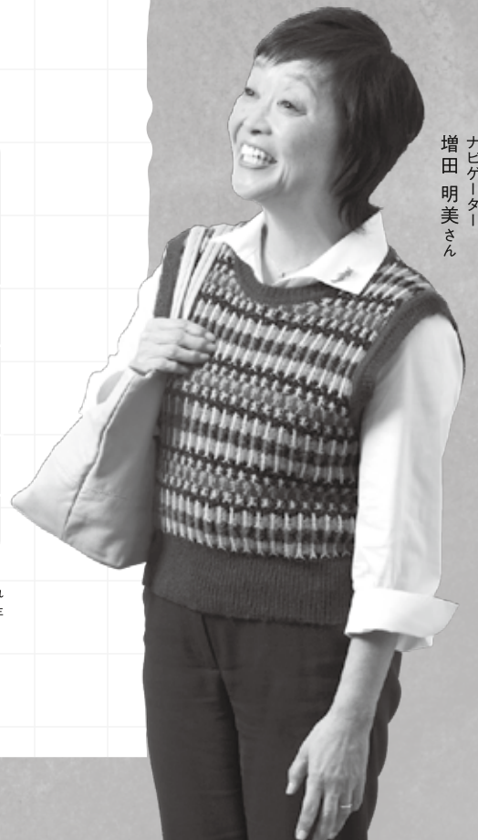
ナビゲーター 増田 明美さん